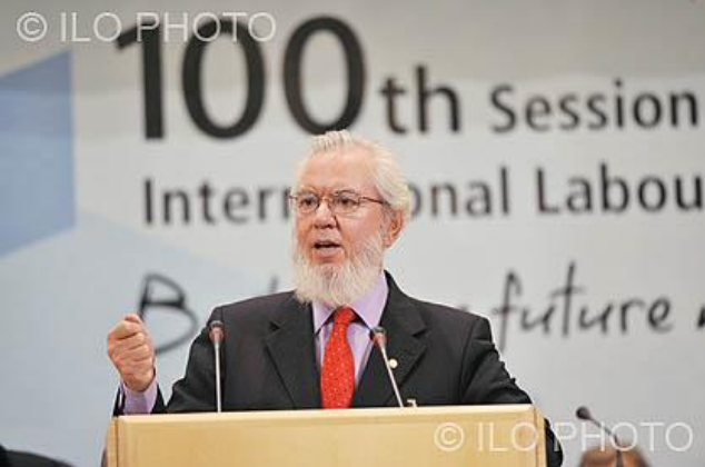
Juan Somavia ILO:n kansainvälinen työkonferenssi 2011

“We are moving the standards system of the ILO into the informal economy for the first time, and this is a breakthrough of great significance. History is being made.”