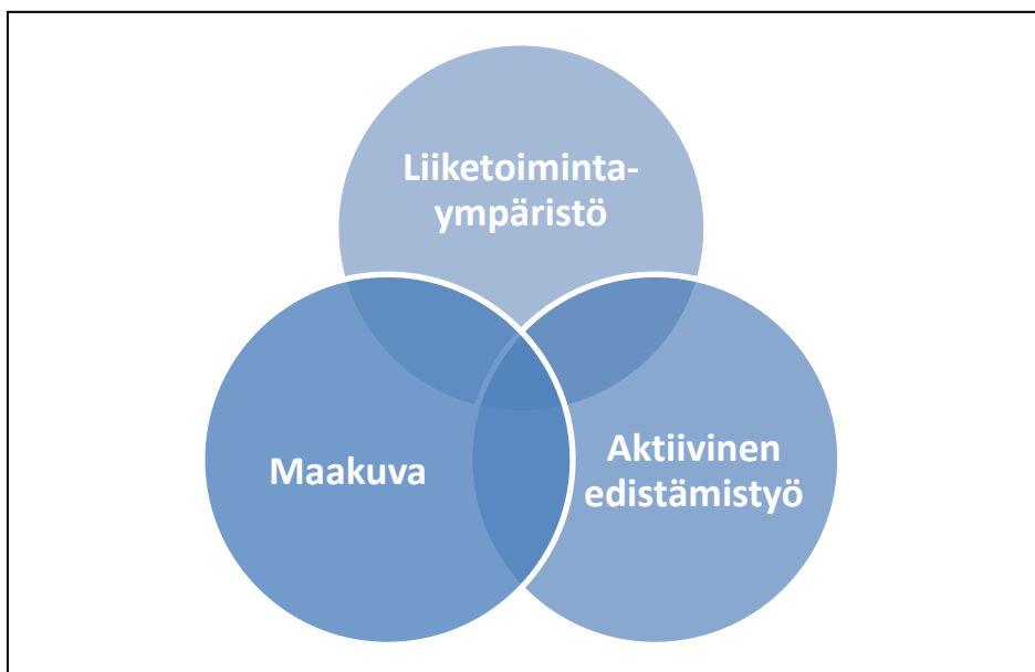
Kuva 2: Ulkomaisten investointien hankinnan peruselementit

Onnistunut ulkomaisten investointien hankinta edellyttää yritystoimintaan kannustavaa liiketoimintaympäristöä, aktiivista edistämistyötä myynnin ja markkinoinnin keinoin, sekä yritysmyönteistä maakuva.