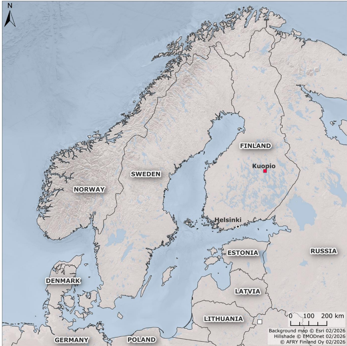
Kuva 2. Kuopion sijainti Suomessa.