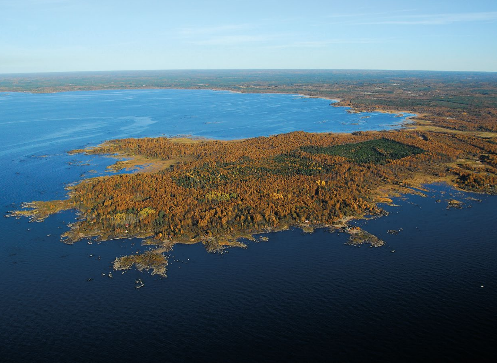
Bild 4 Kärnkraftverkets lokaliseringsområde på Hanhikivi udde.

till det landsomfattande skyddsprogrammet för fågelvatten. I närheten av Hanhikivi finns ett område som klassificerats som nationellt värdefullt fågelområde (FINIBA), flera naturskyddsområden och andra objekt som speciellt bör beaktas.