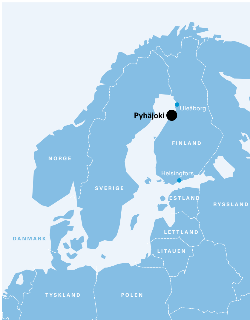
Bild 3 Projektets förläggningssort samt länderna i Östersjöområdet, inklusive Norge.