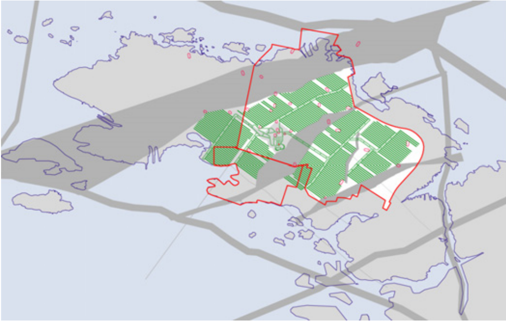
Kuva 3. Esimerkki loppusijoitustilasta 400-450 metrin syvyydellä Olkiluodon kallioperässä noin vuonna 2130 suunniteltuna 12000 tU suuruisen käytetyn polttoainemäärän loppusijoittamiseen kallioperäolosuhteiden mukaisesti YVAa ja periaatepäätöshakemusta varten. Sijoituspaikkatutkimusten perusteella tunnistetut rikkonaisen kallion osuudet on merkitty tumman harmaalla värillä. Loppusijoituksen salliva asemakaava ja luonnonsuojelualue on merkitty punaisella rajauksella.

Laajennettu loppusijoitustila sijaitsisi Olkiluodon kalliolohkon alueella ja sen loppusijoituskapasiteetti kattaisi suunnitteilla olevan 12000 tonnin Olkiluodon loppusijoitustilan lisäksi Fennovoiman käytetyn ydinpolttoaineen loppusijoituksen. Se edellyttäisi siihen tarvittavan kalliovolyymin tutkimista, keskustunnelien jatkolouhintaa riittävän pitkiksi sekä lisäkuilujen rakentamista ilmanvaihtoa (tulo- ja poistoilmakuilut) varten ja tähän tarkoitukseen maanpinnalle rakennettavaa ilmanvaihtolaitosta. Laajentamiseen tarvittavien loppusijoitustunnelien rakentaminen voi tapahtua nykyisestä suunnittelualueesta pohjoiseen tai etelään ranta-alueille tai meren alle. Laajentaminen nykyisestä suunnittelualueesta länteen merkitsisi voimalaitoskäyttöön suunnitellun alueen käyttötarkoituksen muuttamista. Nykyisestä suunnittelualueesta itään päin laajentaessa kalliolohkon rajana oleva ja tähänastisin tutkimuksin varmistettu rikkonaisuusvyöhyke sijaitsee lähellä ja rajoittaa käytettävää kalliotilavuutta.