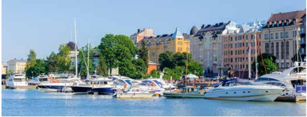
Anttoni Haravuori/ Shutterstock