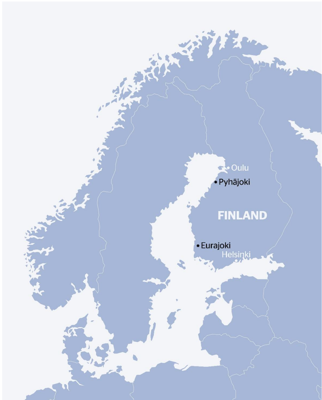
Bild 3. Pyhäjoki och Euraåminne geografiska läge.