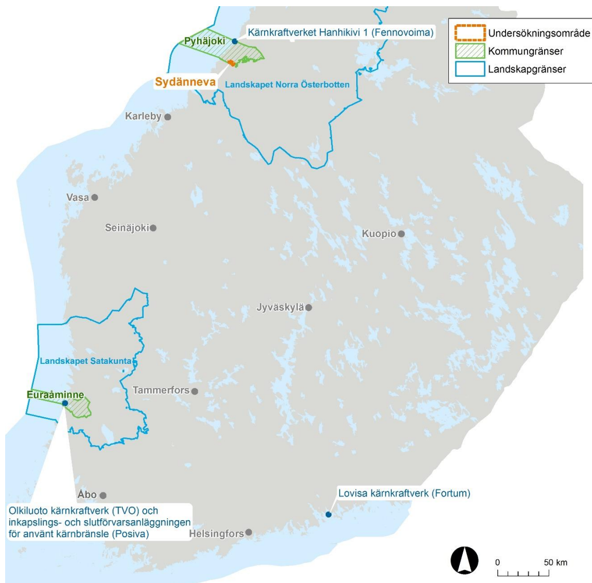
Bild 4. De alternativa förläggningssorterna.