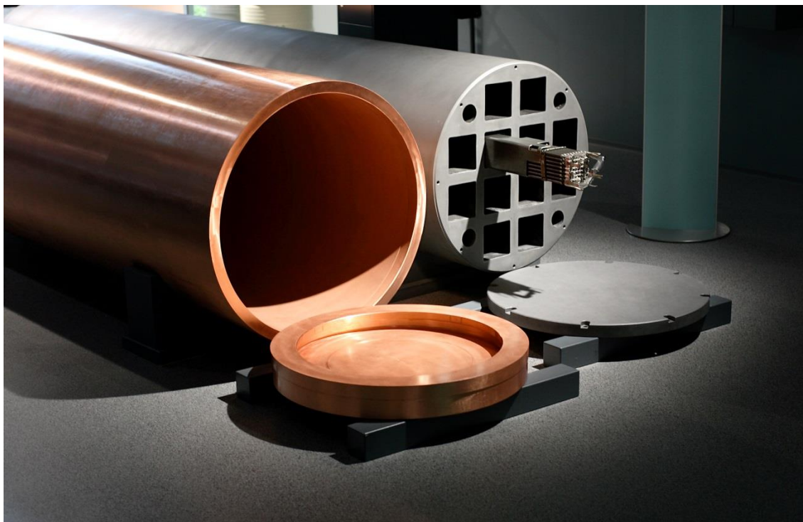
Bild 2. Insats och hölje för en slutförvaringskapsel. På bilden syns en kapsel för Olkiluoto 1 och 2, som mäter 1,05 meter i diameter och 4,8 meter på längden. Fennovoimas kapslar är något längre och har en annan typ av insats.

Med "inkapslingsanläggning" avses en kärnanläggning där använt kärnbränsle kapslas in i slutförvaringskapslar. Slutförvaringskapseln är en massiv metallbehållare som består av en insats av gjutjärn och ett yttre hölje av koppar (Bild 2).