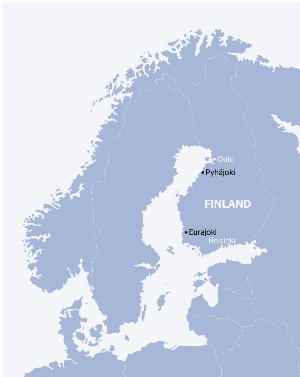
Rysunek 3. Lokalizacje w Pyhäjoki i Eurajoki.