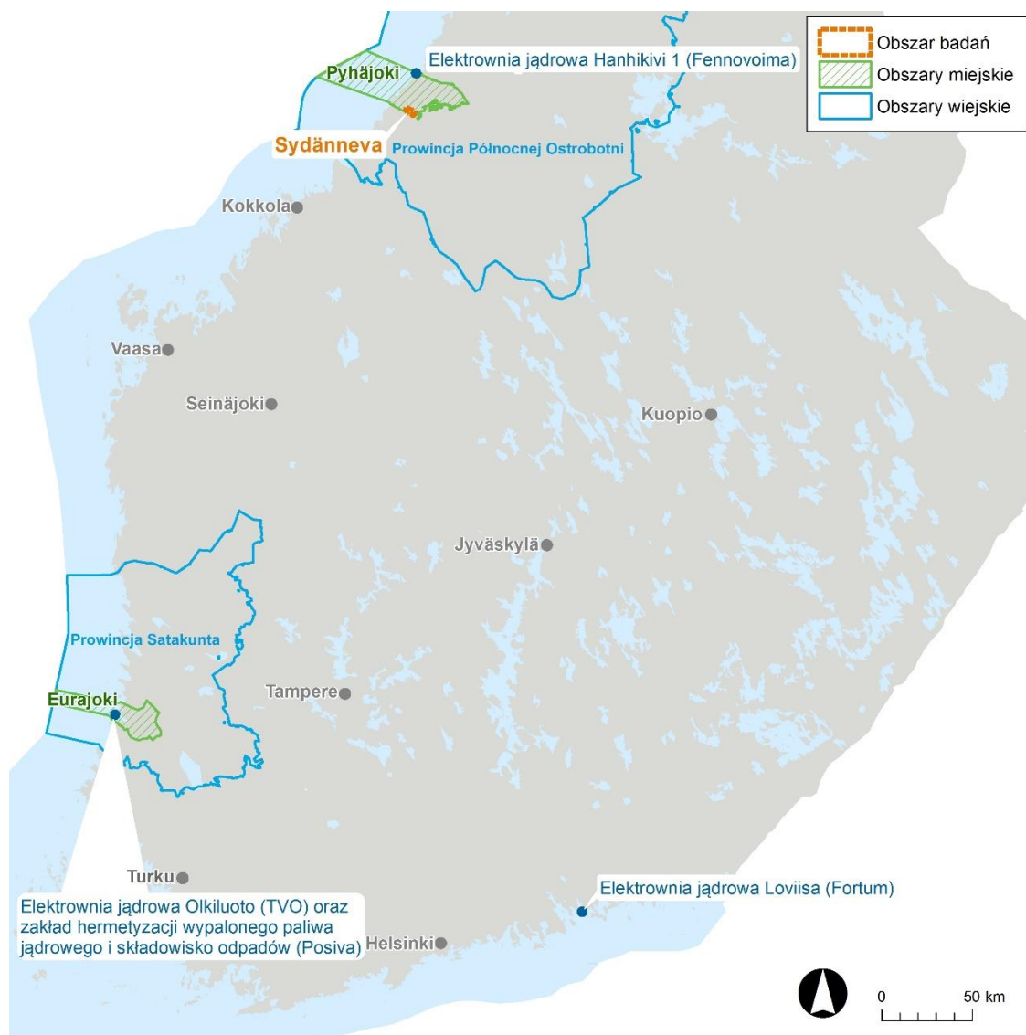
Rysunek 4. Lokalizacje alternatywne.