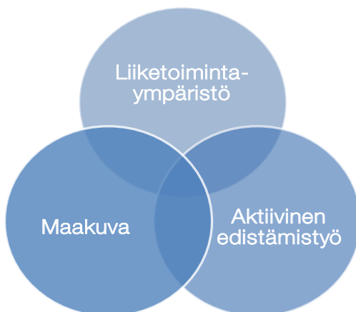
Kuva 2. Ulkomaisten investointien hankinnan peruselementit

Onnistunut ulkomaisten investointien hankinta edellyttää yritystoimintaan kannustavaa liiketoimintaympäristöä, aktiivista edistämistyötä myynnin ja markkinoinnin keinoin, sekä yritysmuotoista maakuva.