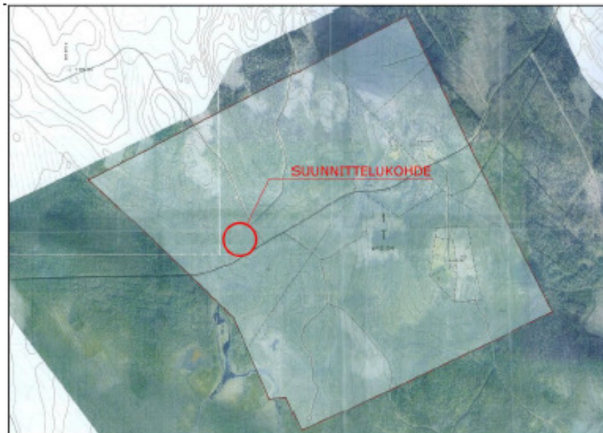
Ote 29.8.2006 hyväksytystä asemakaavasta.