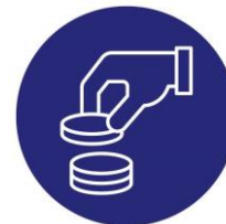
Hintakilpailu ja kustannuspaineet