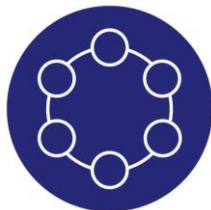
Arvoketjut ja ekosysteemit